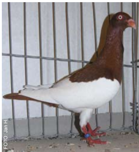
Dansk Tomler, rød skade.

Det var det jeg har valgt at skrive i denne omgang, vil ønske de Norske opdrættere en god sæson 2008.