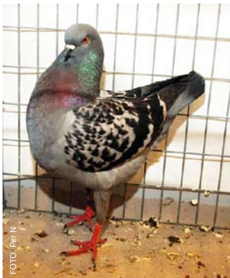
Tyske Modenesere, blå ternet. Eier: Trond Børseth