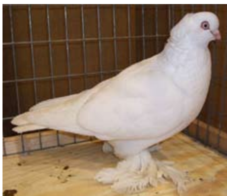
Norsk Tomler, hvit. Eier: Sigurd Haukås