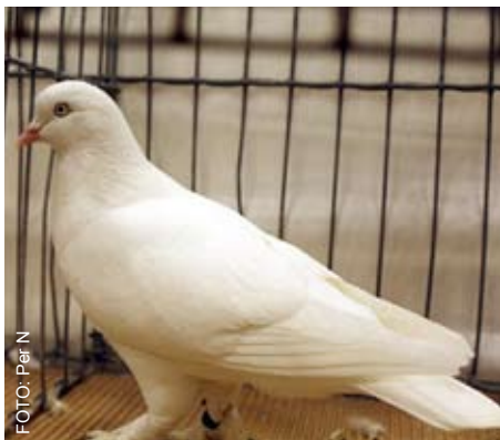
Bergenstomler - hvit.

Med så varierende typer i burene var det litt overraskende at utstillerne som var tilstede i hallen ikke tok kontakt med