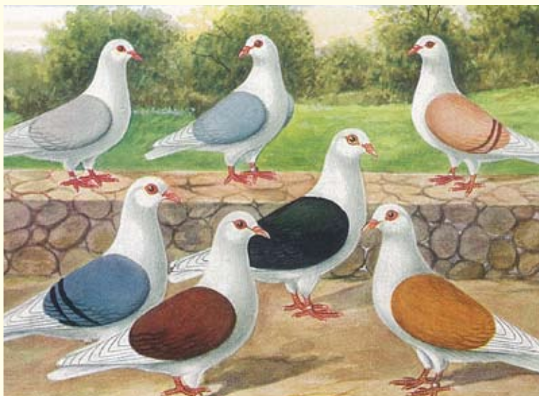
Fränkische Schildtauben (Samtschilder)