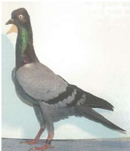
Wiener Høytflyger, blå, han, 96 poeng. Utstiller: Olav Hermod Kydland.