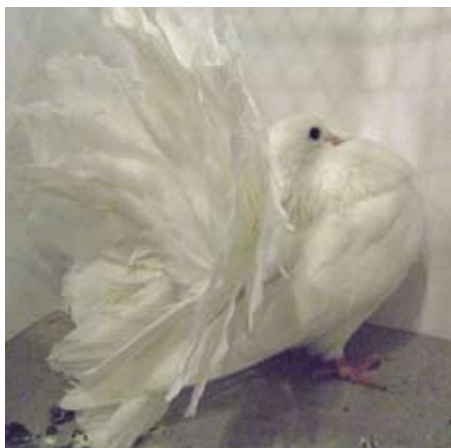
Engelsk høystjert, hvit. Eier: Tor Meland

Så en ekstra hyggelig opplevelse: 3 indiske høystjertes, hvite med blå haler, spisskappet med gode hoder, bra kropp og god stilling. Best her burnr 472, 1 ung hunn, 95p.