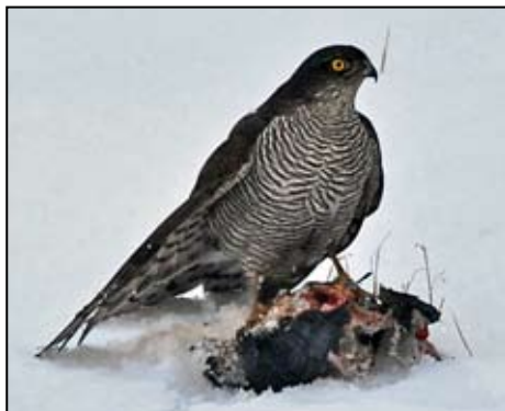
Fra et besøk av en frekk spurvehawk hunn. Offeret er en sort b-due hann fra 2006.