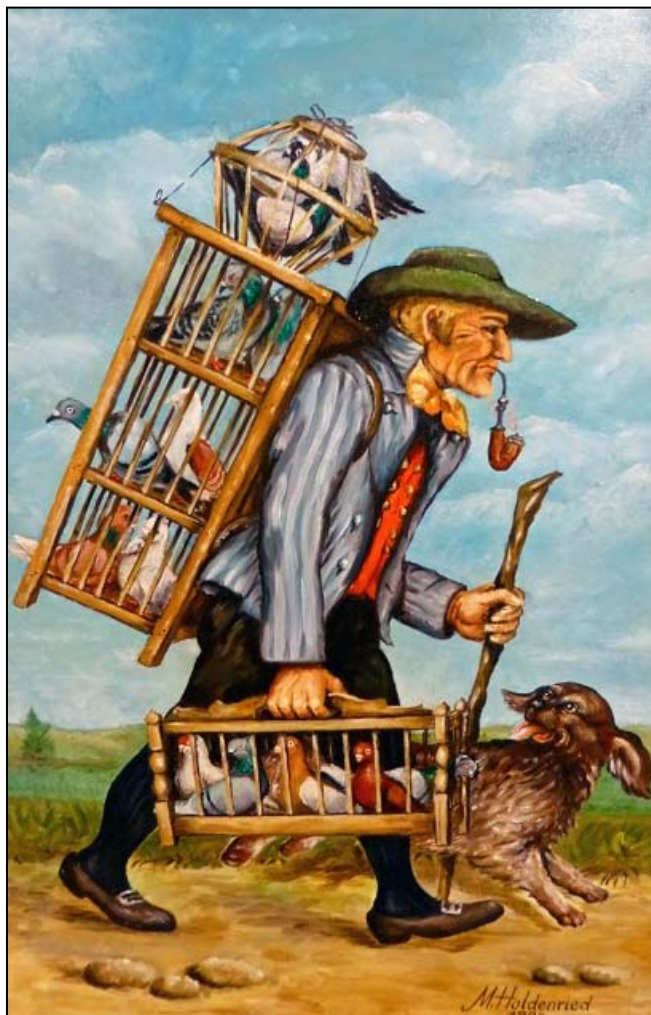
Reisende duehandler. Bildet tatt på Sollfrank Taubenmuseum.