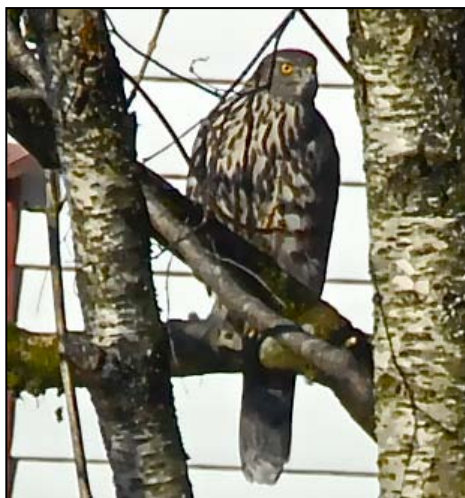
Dagens vaktmesterinne, en ung hønehawk hunn.