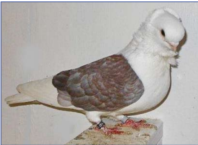
En rasetypisk Norsk Petent

Noen sikker dokumentasjon på hva som er helt riktig, finnes dog ikke. Men en ting er nok sikkert: Alt tyder på at rasen er langt eldre enn Norsk Tomler. En annen ting er at rasen i all tid har befunnet seg frittflyvende på gårder over hele Østfold, og også store deler av Vestfold. Og alltid har de kunnet