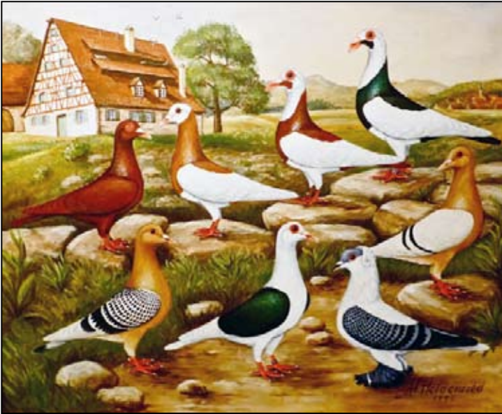
Lokalrasene fra Nürnbergområdet. Bildet tatt på Sollfrank Taubenmuseum