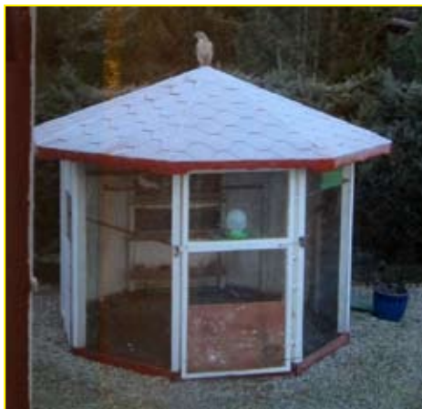
Hauken sitter klar på duepaviljongen til Per og venter...

● Heldige var de som fikk med seg Norge rundt tre fredager på rad, siste gang var fredag 08.02.