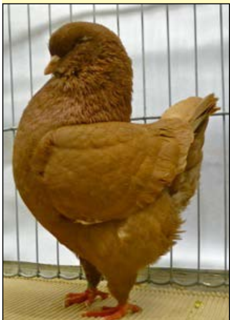
Beste schietti, rød, eldre hann, J. Heldal 97 p