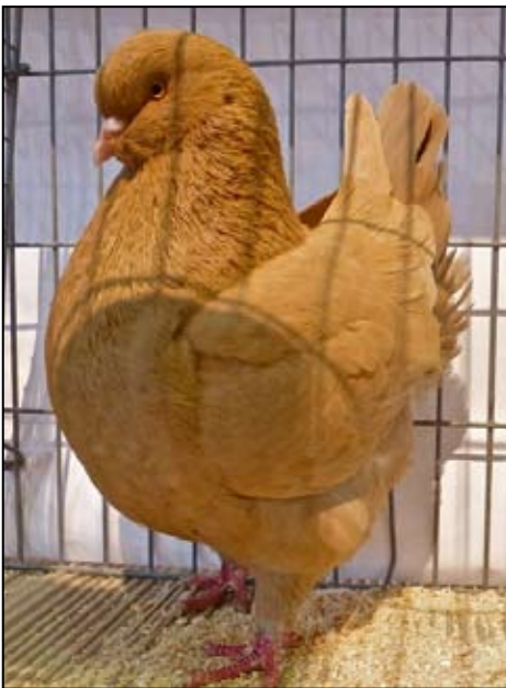
Beste Modena, gul, eldre hann. Utstiller; Ron Nicholson.

Etter årsmøtet pakket deltagerne ned duene og reiste hver til sitt. For vår del var vi enige om at det hadde vært en fin helg med gode opplevelser. Vi håper dette er noe vi kan gjenta og forhåpentligvis også stille ut egne duer.