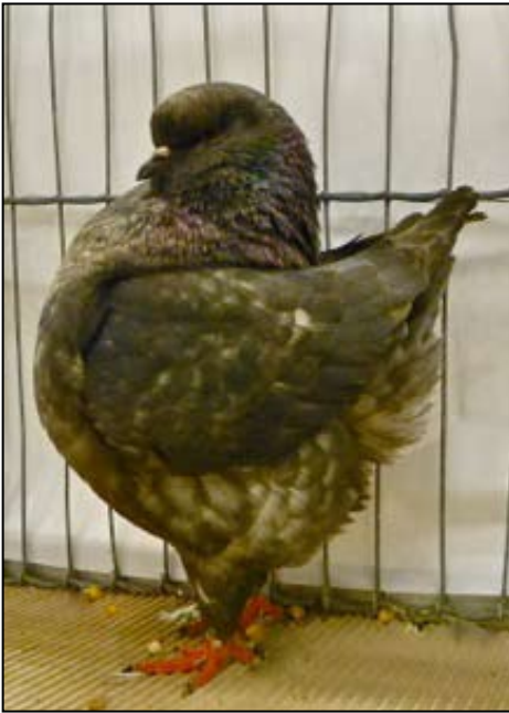
Sort opal, ung hunn, J. Helda, 96 p.