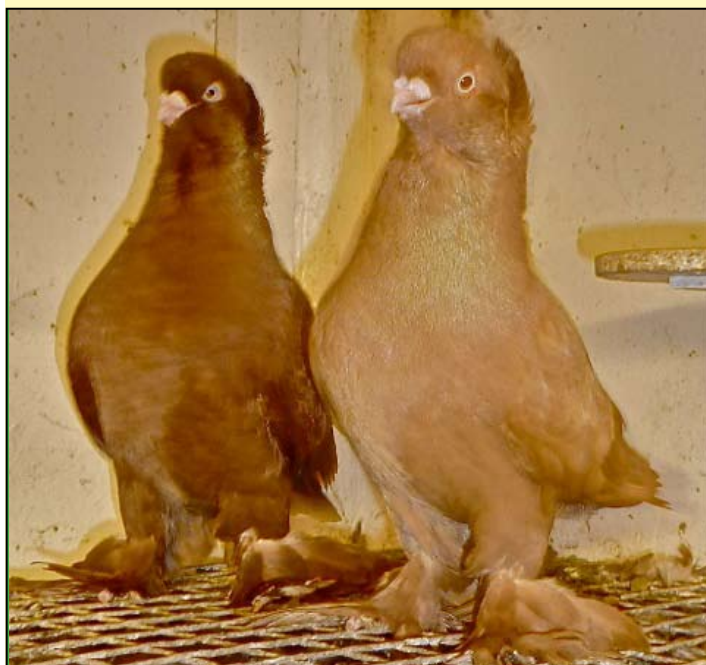
To sterke representanter for rasen med kraft, sokker og holdning.