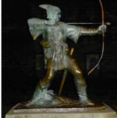
Like utenfor Nottingham ligger Sherwood Forest der Robin Hood hadde sitt hovedkvarter.

Newcastle til Leeds og dessuten i det sydlige England.