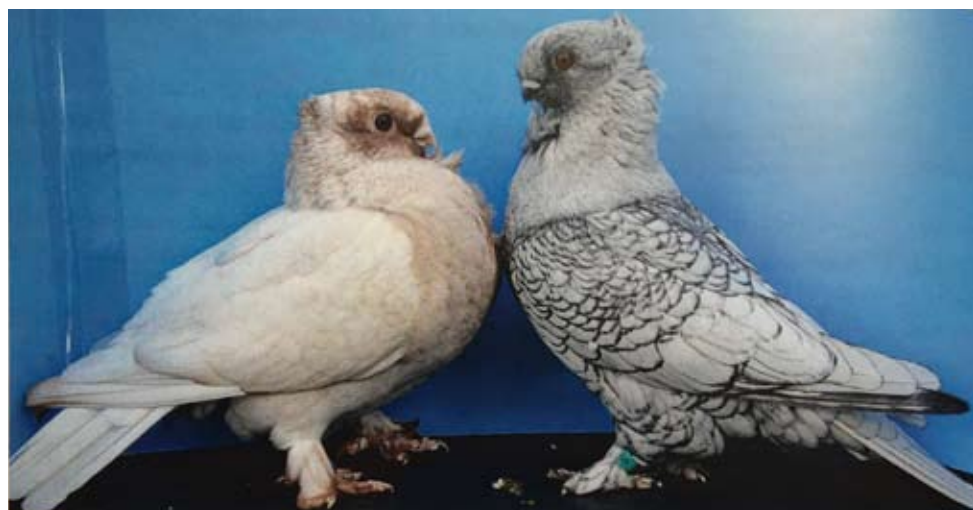
Rød og sortrandet frost

I USA er betegnelsen: Red and black frosty.