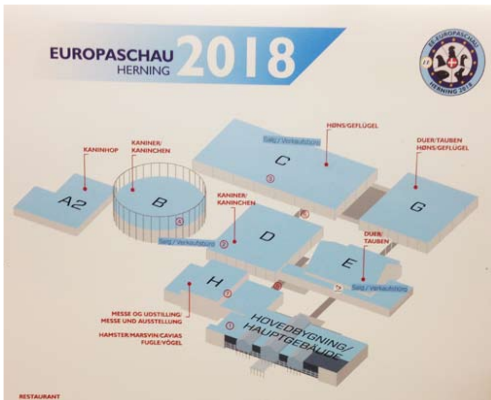
Kart med oversikt over de forskjellige bygningene og området for den enorme utstillingen var til god hjelp, men det var fullt mulig å gå seg vill...