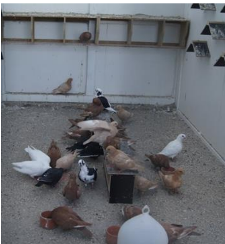
Flotte Afrikanere i både gult, rødt, broget og hvit.