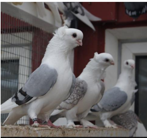
Fremst, en fantastisk flott Svensk Mefikk (Svensk Kråsduva)