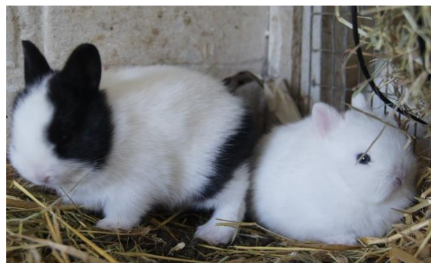
Også hermelinene/dvergkaninene fattet interesse.