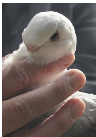
Hodestudie av en flott Tysk Skjoldmefikk.