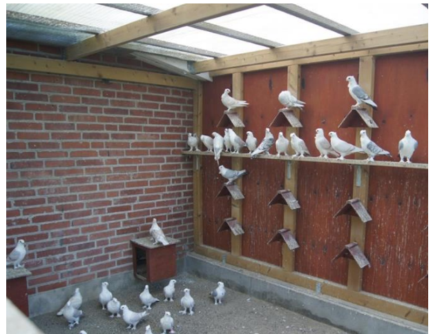
Flotte gammel Orientaliske Mefikker i et godt åpent dueslag.