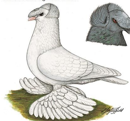
Standardbilde tegnet av Frindel

Samtidig ble den "Russiske trommedue" foredlet videre til etterhvert å bli anerkjent i ny drakt som Tysk dobbelkappet trommedue. Likeledes ble flere av disse krysninger brukt videre for å fremstille fargeduer med kappe og nebbrosett.